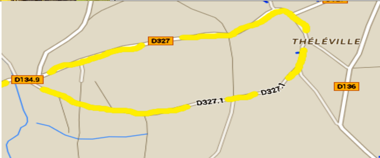
La tournée du facteur

Le facteur vous proposera également une épreuve bien à lui. Reportez vos réponses dans le tableau ci-après :