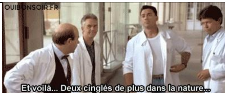
Et voilà... Deux cinglés de plus dans la nature...