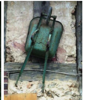
Photo1 avant photo2 ou Photo2 avant photo1 Entourez ce qui convient