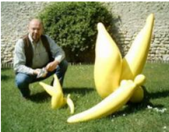
1994 Meilleur Ouvrier de France section "Travaux Marbriers"