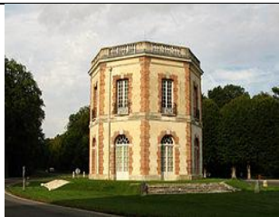
Pavillon de chasse Octogonal