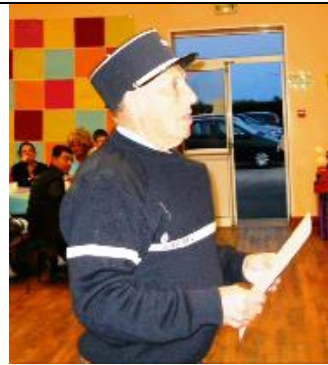
On répond : « Oui ! Chef ! »

Et finalement, sur ce Rallye, en ce qui concerne la forêt de Dreux, nous allons nous limiter qu'au pavillon de chasse qui clôturera l'itinéraire. Néanmoins, nous avons conservé un site incontournable se trouvant à proximité. Il s'agissait de l'aqueduc de Montreuil dont j'avais