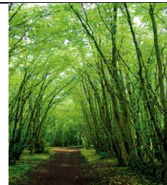
Sentier en foret

eu connaissance en 1991 pour l'avoir emprunter lors d'une marche pendant mon service militaire. Le brigadier Poulain (91/04) était en Camp dans le foret de Dreux avec L'ERGMU de Châteaudun et à l'époque on était passé librement dessus pour finir sur la montée de la photo2.