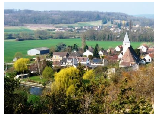
Montreuil (vue d'en haut)