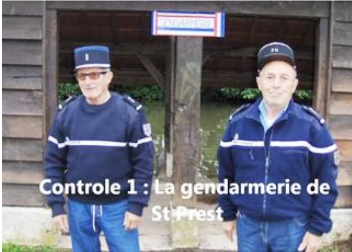
Contrôle 1 : La gendarmerie de St-Prest