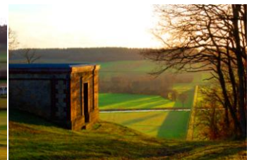
L'aqueduc de Montreuil et sa montée en foret