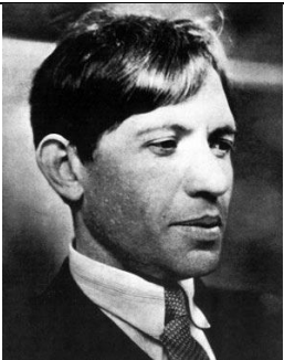
Chaim Soutine, la peinture