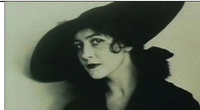
Madeleine Castaing, la décoration

Bienvenue au grenier de l'histoire à Lèves.