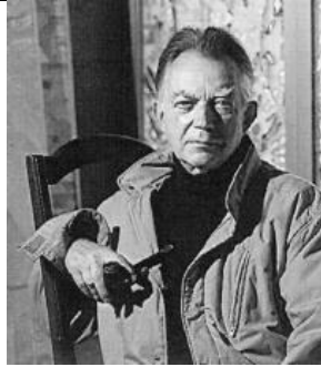
Gabriel Loire, le Vitrail

Voici cinq personnages qui font partie de l'histoire de Lèves. Qui sont-ils et quel est leur domaine d'activité ?